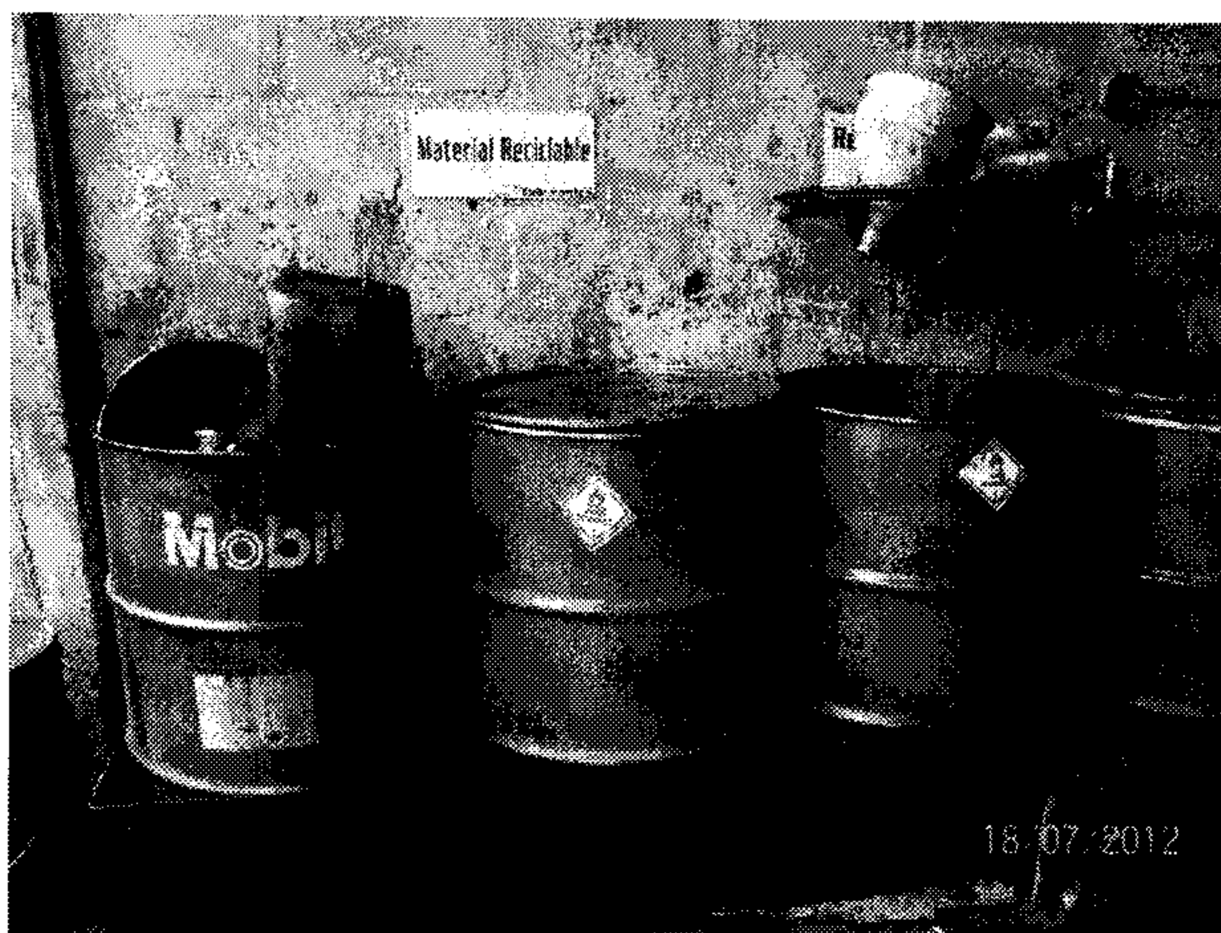
Fotografía 37: Almacenamiento de residuos peligrosos

Por la actividad productiva se generan residuos peligrosos como aceite usado, estopas y/o material absorbente impregnado de grasa y/o aceite y filtros de aceite. Se evidenció buena separación de este tipo de residuos en la fuente en recipientes rotulados; el almacenamiento se hace en una zona sobre piso duro y bajo techo, en donde no se evidencia riesgo de contaminación de recursos como el agua y suelo en caso de un derrame accidental.